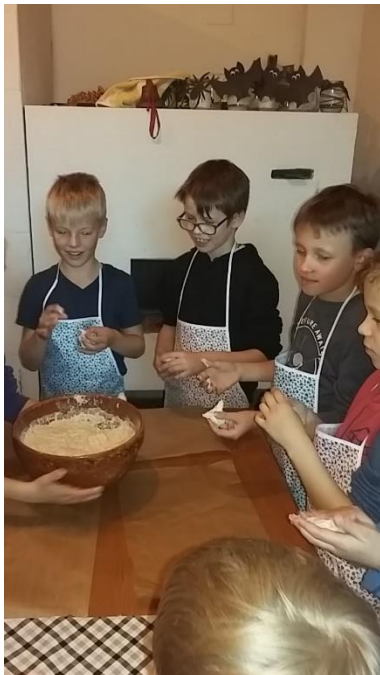
Top ūdens kliņģeri