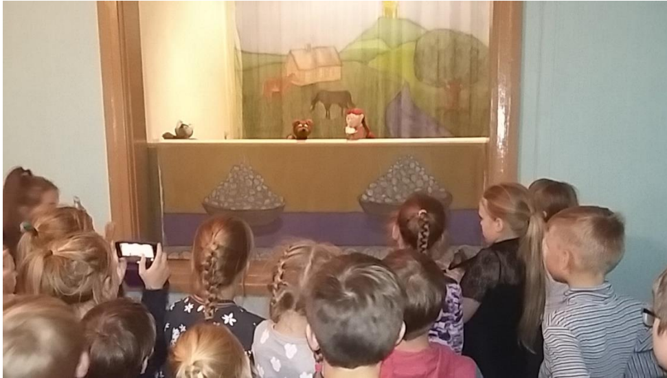
Fragments, no skolēnu uzvestā leļļu teātra.

Bet radošajās meistardarbnīcās biedrībā "7BALLES", skolēni uzzināja par amatniecību, par tās vēsturiskajām tradīcijām un mūsdienīgo attīstību. Atbilstoši savām interesēm, skolēni piedalījās sveču liešanas, tinglošanas un kokamatniecības darbnīcās, uz brīdi kļūstot par amatniekiem.