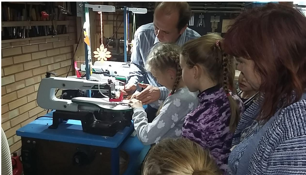
Meitenes ieinteresēti griež koka figūriņas.