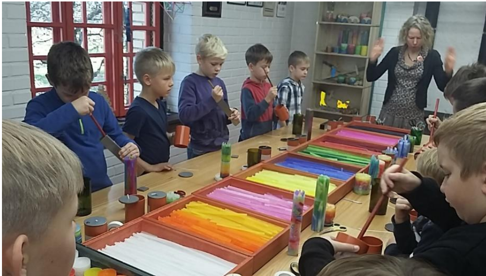
Tiek izskaidrots sveču liešanas process – tūlīt taps radošie darbi.